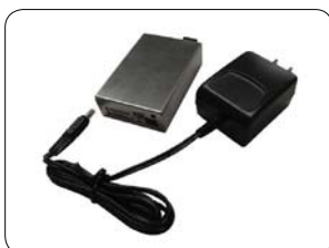
ACモデル 電源電圧 AC100V(±10%) サイズ W44×D56×H28mm 質量 90g