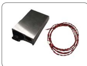
DCモデル 型番 SCMC03*-**-DC