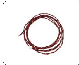
DCコード(2m) SCMC03-DC 電源電圧 DC6~24V