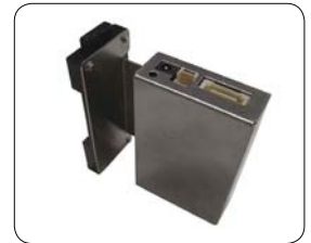
DINレール取付け金具 SCMC03-DIN