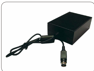
AC 電源アダプタ (SCMC01-PW) 定格電圧 AC100 ~ 240V 使用温度 -40 ~ +60℃ 質量 320g